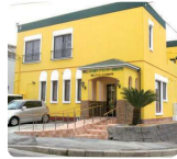
IGLふれ愛ケアセンター 美鈴が丘