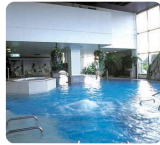
健康増進施設 クアリウムシャレー