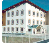
サムエル東広島こどもの園