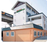
IGL医療福祉専門学校