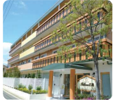
IGL高齢複合施設 ベルビュー広島