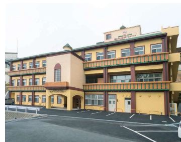
ユニット型特別養護老人ホーム ナーシングホームシャレー

要介護度3以上の80人を受け入れており、入居者の状態です。プライバシーが確保できる個室で生活しながら、ユニットごとに共有スペースでコミュニケーションを深めています。リゾート施設のような内装や屋上庭園も好評です。今後は、広島市内で空き家になった物件などをデイサービス施設に改装する計画を立てています。