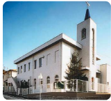
日本ホーリネス教団 広島福音教会