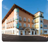
サムエル西条こどもの園