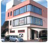
IGLふれ愛ケアセンター ベルビュー広島