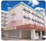
IGL高齢複合施設 ベルビュー河原町