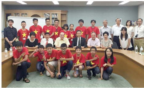
2016年7月 理事長室にて

昨年7月、ベトナム・ハノイの青少年センターに所属している中学生から大学生が広島市に來られ交流会を行いました。IGLからも10、11月に青少年センターを訪問。これをきっかけにセンターの方々と一緒に健康事業を中心に貢献したいと考えています。ベトナムでは健康への関心が高く、中間層や富裕層を中心にスポーツの需要が伸びると見込んでいます。中国でも10年以上前から老人ホームなどのコンサルティングを手掛けています。大連や北京、重慶などで、デイケア施設の開設を検討しています。認知症やパーキンソン病などの治療のノウハウも生かしていきます。