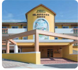
IGL高齢複合施設 西風新都 アルペンローゼ