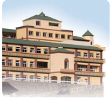
介護老人福祉施設 IGLナーシングホームシャレー