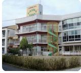
特別養護老人ホーム ナーシングホームゆうゆう