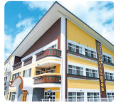
サムエル未来こどもの園