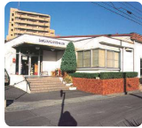
ジャパン・スイミングスクール 広島