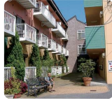
グループホームゆうゆう