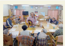
ふれあいコーラス