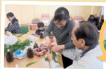
短時間で素敵なリースが完成しました。