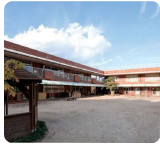
サムエル薬師が丘こどもの園