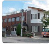
サムエル美鈴が丘こどもの園

IGL(インターナショナル・ゴスペル・リーグ/国際福音連盟)は、米国カリフォルニア州のバサデナという町に本部を置き、世界各国にある福音主義の教会を援助していた団体です。当グループも精神的母体である広島福音教会が、苦悶窮しているときに助けていただき、これを永く記念する意味で名称とさせていただきます。