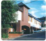
サムエル広島こどもの園