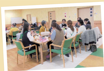
皆さまとお鍋を囲み盛り上げました。