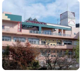
特別養護老人ホーム 第二ナーシングホームゆうゆう