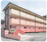
サムエル広島こどもの園分園