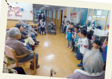
サムエル園児来訪