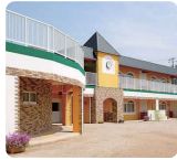
サムエル信愛こどもの園