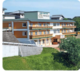
高齢者複合施設 アルペンローゼ