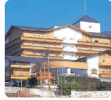
介護老人保健施設 ベルローゼ ケアハウスふれ愛