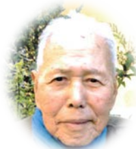
谷本 清 様・作