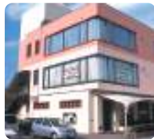
IGLふれ愛ケアセンター