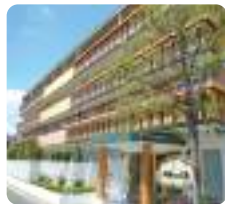
IGL高齢複合施設 ベルビュー広島