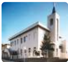
日本ホーリネス教団 広島福音教会