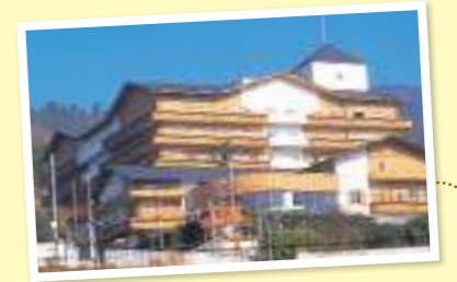
介護老人保健施設 ベルローゼ ケアハウスふれ愛