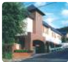
サムエル広島こどもの園