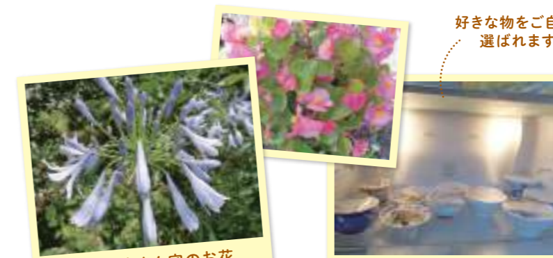
ご利用者さん宅のお花