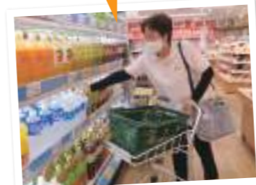
移動途中に買い物