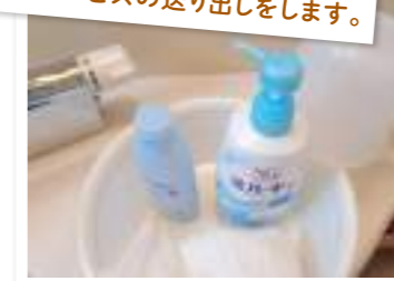
入浴介助もできます。