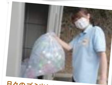
日々のゴミ出しは欠かせません!