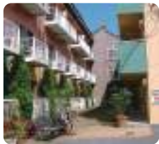
グループホームゆうゆう