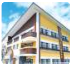
サムエル未来こどもの園