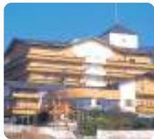
介護老人保健施設 ベルローゼ ケアハウスふれ愛