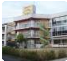
特別養護老人ホーム ナーシングホームゆうゆう