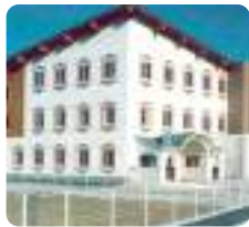
サムエル東広島こどもの園