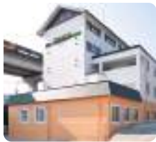
IGL医療福祉専門学校