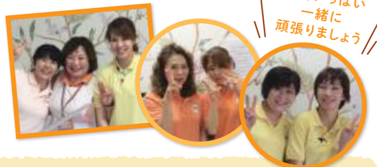
元気いっぱい 一緒に 頑張りましょう

IGL デイサービスあさひが丘 〒731-3361 広島市安佐北区あさひが丘3-18-13-7 TEL.082-810-4788