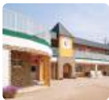
サムエル信愛こどもの園