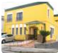
IGLふれ愛ケアセンター 美鈴が丘