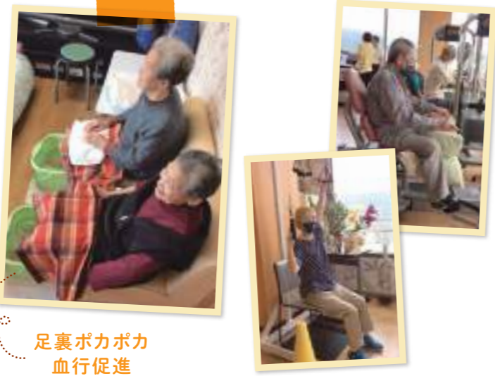
足裏ポカポカ 血行促進