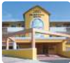
IGL高齢複合施設 西風新都