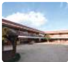
サムエル薬師が丘こどもの園