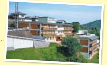
高齢者複合施設 アルペンローゼ