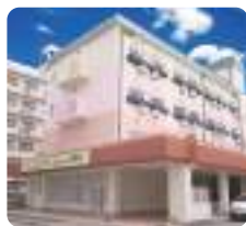
IGL高齢複合施設 ベルビュー河原町