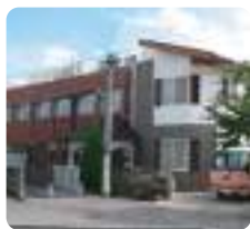
サムエル美鈴が丘こどもの園

IGL (インターナショナル・ゴスペル・リーグ・国際福音連盟)は、米国カリフォルニア州のパサデナという町に本部を置き、世界各国にある福音主義の教会を援助していた団体です。当グループも精神的母体である広島福音教会が、昔困窮しているときに助けていただき、これを永く記念する意味で名称とさせていただきます。