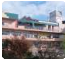
特別養護老人ホーム 第二ナーシングホームゆうゆう