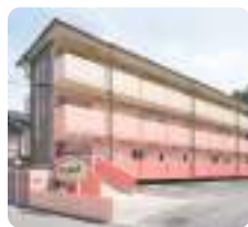
サムエル広島こどもの園分園