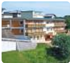
高齢者複合施設 アルペンローゼ