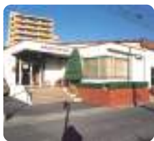
ジャパン・スマイリングスクール 広島