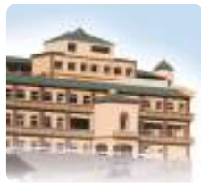
介護老人福祉施設 IGLナーシングホームシャレー