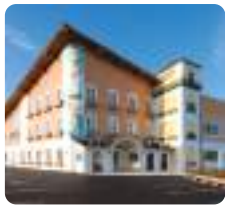
サムエル西条こどもの園