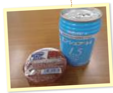
ご利用される方、多いです。