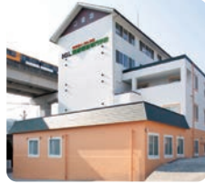
IGL医療福祉専門学校