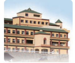
介護老人福祉施設 IGLナーシングホームシャレー