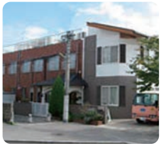
サムエル美鈴が丘こどもの園

IGL (インターナショナル・ゴスペル・リーグ・国際福音連盟)は、米国カリフォルニア州のパサデナという町に本部を置き、世界各国にある福音主義の教会を援助していた団体です。当グループも精神的母体である広島福音教会が、昔困窮しているときに助けていただき、これを永く記念する意味で名称とさせていただきます。