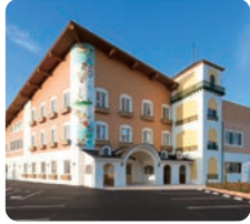
サムエル西条こどもの園