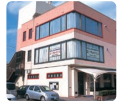
IGLふれ愛ケアセンター