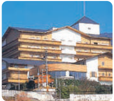
介護老人保健施設 ベルローゼ ケアハウスふれ愛