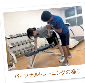
パーソナルトレーニングの様子

また姿勢改善、体のケアなどにおススメなパートナーストレッチは担当トレーナーがマンツーマンで無理なく筋肉を伸ばしていきます。お客さまが理想の身体に近づけるよう、サポートしています！