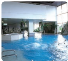
健康増進施設 クリアウムシャレー