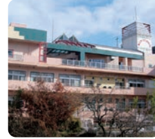
特別養護老人ホーム 第二ナーシングホームゆうゆう