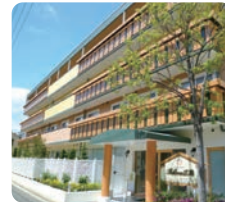
IGL高齢複合施設 ベルビュー広島