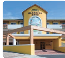
IGL高齢複合施設 西風新都