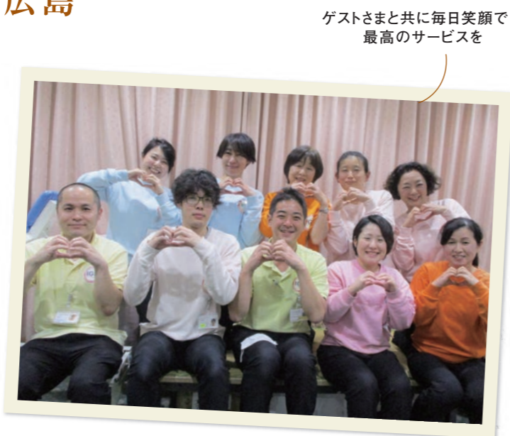
ゲストさまと共に毎日笑顔で 最高のサービスを

職員それぞれがクラブを担当し、勉強を重ね、工夫を凝らし、ゲストさまと共にクラブ活動を行っています。毎月行われる行事は、季節を感じ、元気で笑顔があふれる空間をお届けしています。