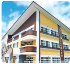
サムエル未来こどもの園