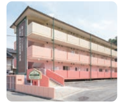
サムエル広島こどもの園分園