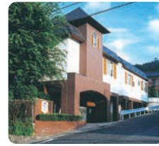
サムエル広島こどもの園