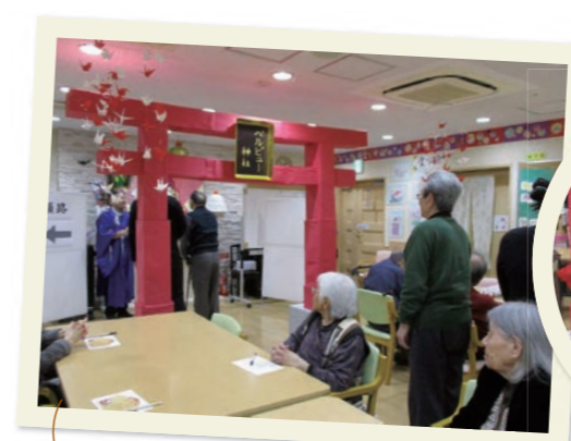
室内に鳥居が できました