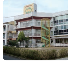
特別養護老人ホーム ナーシングホームゆうゆう