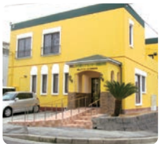
IGLふれ愛ケアセンター 美鈴が丘