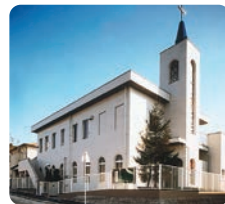
日本ホーリネス教団 広島福音教会