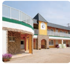
サムエル信愛こどもの園