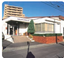
ジャパン・スイミングスクール 広島