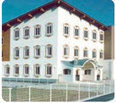
サムエル東広島こどもの園