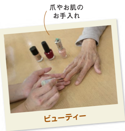
爪やお肌のお手入れ