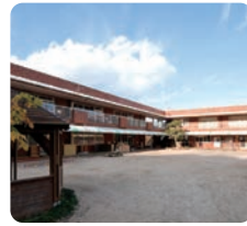
サムエル薬師が丘こどもの園