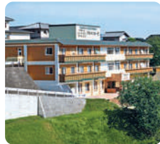
高齢者複合施設 アルペンローゼ