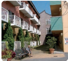
グループホームゆうゆう