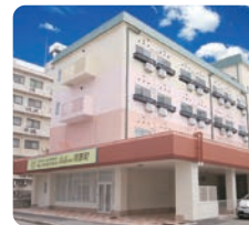
IGL高齢複合施設 ベルビュー河原町