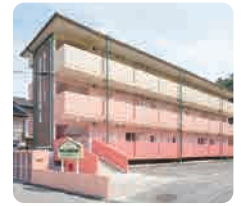
サムエル広島こどもの園分園