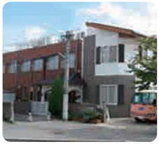
サムエル美鈴が丘こどもの園

IGL (インターナショナル・ゴスペル・リーグ・国際福音連盟)は、米国カリフォルニア州のパサデナという町に本部を置き、世界各国にある福音主義の教会を援助していた団体です。当グループも精神的母体である広島福音教会が、昔困窮しているときに助けていただき、これを永く記念する意味で名称とさせていただきます。