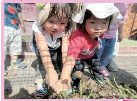
よしよ! うんとこしょ!