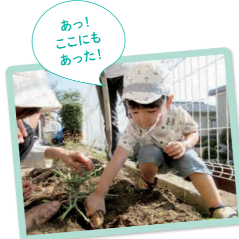
あっ! ここにも あった!