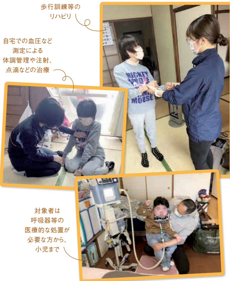
歩行訓練等の リハビリ