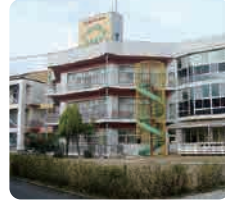
特別養護老人ホーム ナーシングホームゆうゆう