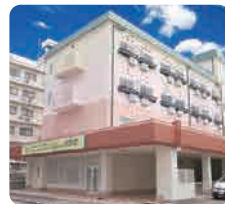
IGL高齢複合施設 ベルビュー河原町