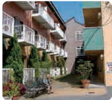
グループホームゆうゆう