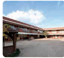
サムエル薬師が丘こどもの園