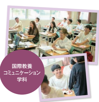
国際教養コミュニケーション学科