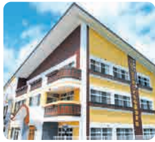
サムエル未来こどもの園