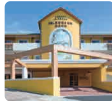
IGL高齢複合施設 西風新都