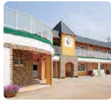
サムエル信愛こどもの園