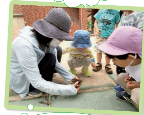
お花が終わった後を のぞいてみると…