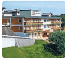
高齢者複合施設 アルペンローゼ