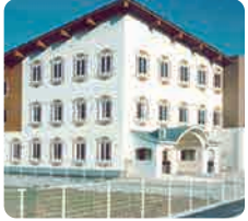
サムエル東広島こどもの園