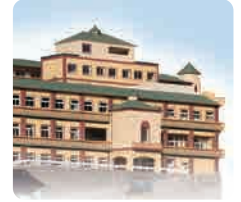
介護老人福祉施設 IGLナーシングホームシャレー