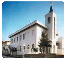
日本ホーリネス教団 広島福音教会