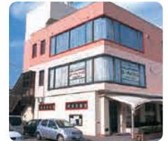
IGLふれ愛ケアセンター