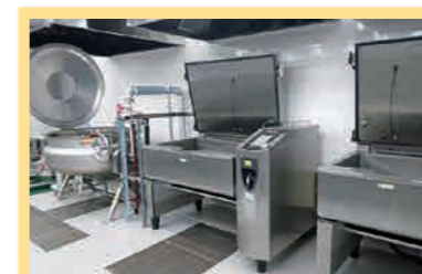
回転釜・アイバリオ