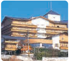
介護老人保健施設 ベルローゼ ケアハウスふれ愛