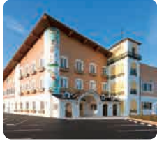
サムエル西条こどもの園