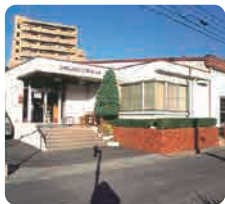
ジャパン・スイミングスクール 広島