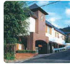
サムエル広島こどもの園