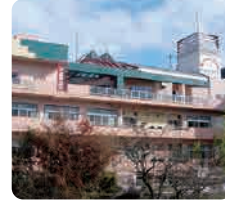
特別養護老人ホーム 第二ナーシングホームゆうゆう