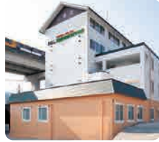
IGL医療福祉専門学校