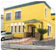
IGLふれ愛ケアセンター 美鈴が丘