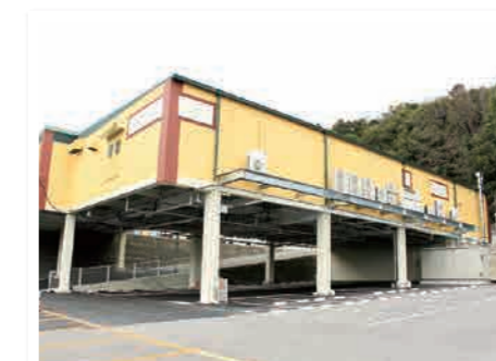
東側から見たセントラルキッチン