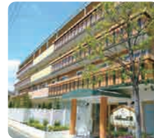
IGL 高齢複合施設 ベルビュー広島