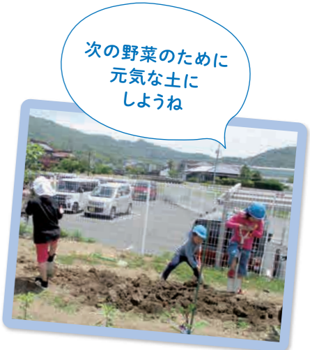
次の野菜のために 元気な土に しようね