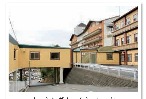
ナーシングホームシャレーと連結されたセントラルキッチン