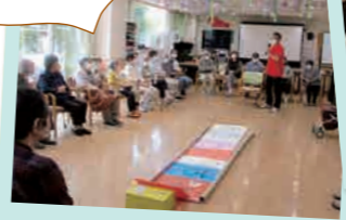
レクリエーション大会