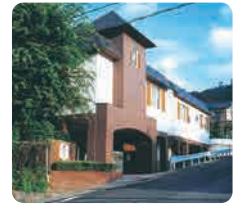
サムエル広島こどもの園