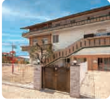
サムエル広島こどもの園ベル分園