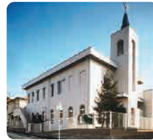
日本ホーリネス教団 広島福音教会