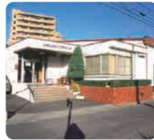
ジャパン・スマイリングスクール 広島