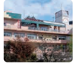
特別養護老人ホーム 第二ナーシングホームゆうゆう