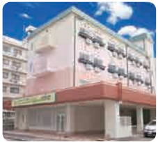
IGL高齢複合施設 ベルビュー河原町