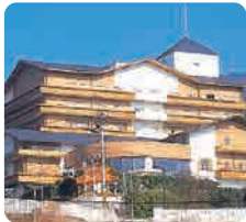
介護老人保健施設 ベルローゼ ケアハウスふれ愛