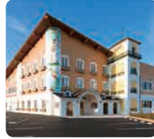
サムエル西条こどもの園