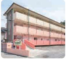
サムエル広島こどもの園分園