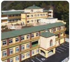
介護老人福祉施設 IGLナーシングホームシャレー