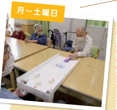
週替わりでレクをおこなっています