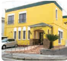
IGLふれ愛ケアセンター 美鈴が丘