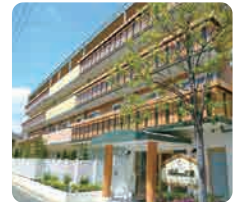
IGL高齢複合施設 ベルビュー広島