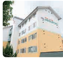
IGL医療福祉専門学校