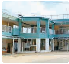
サムエル薬師が丘こどもの園