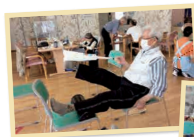
自宅で出来る運動 体のケア方法を 行なっています。