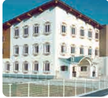
サムエル東広島こどもの園